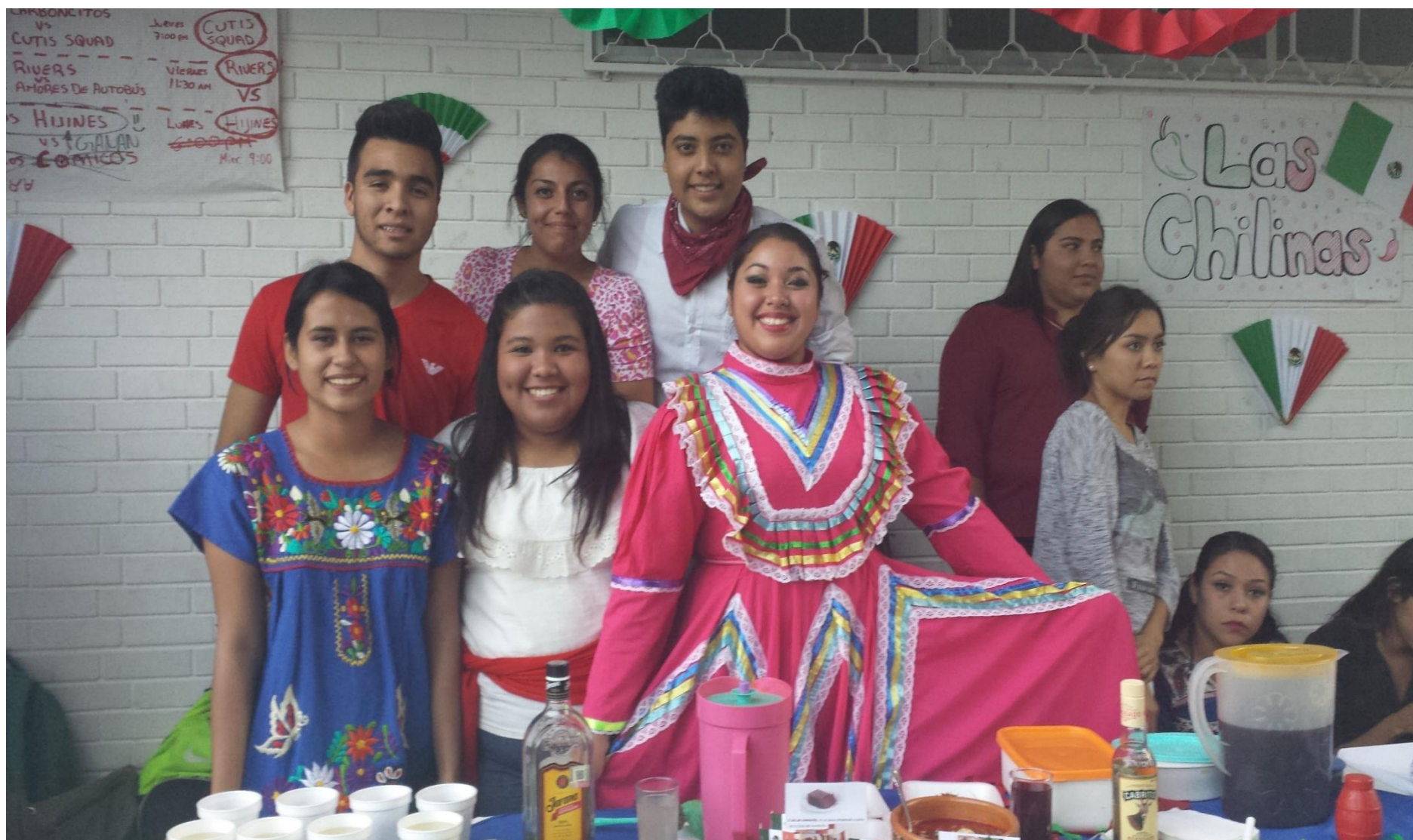
Figura 7. Exposición de platillos típicos mexicanos.