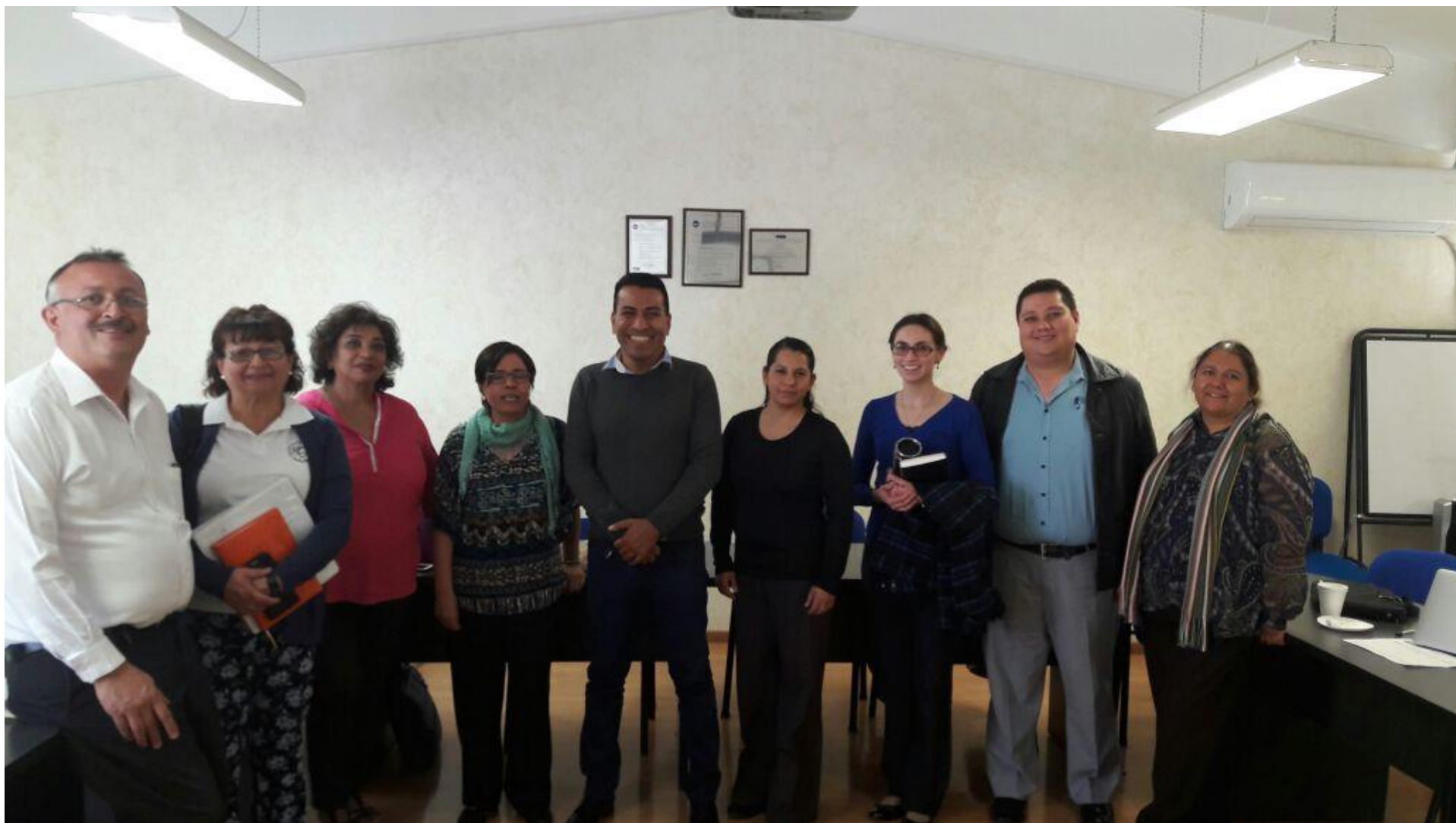
Figura 2. Reunión de trabajo de la DES Químico Biológicas