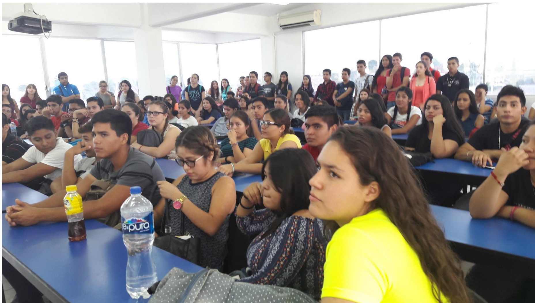
Figura 8. Plática de Requisitos para la realización de Servicio Social y Prácticas Profesionales.