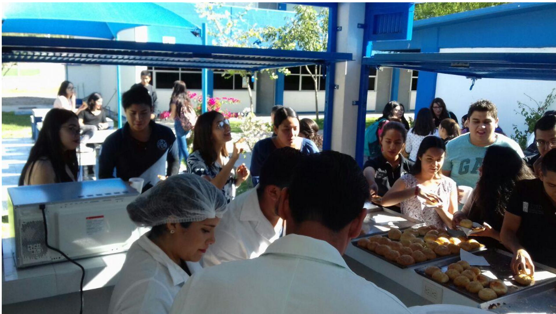
Figura 12. Inauguración del expendio de productos alimenticios del Laboratorio de Tecnología de Alimentos.