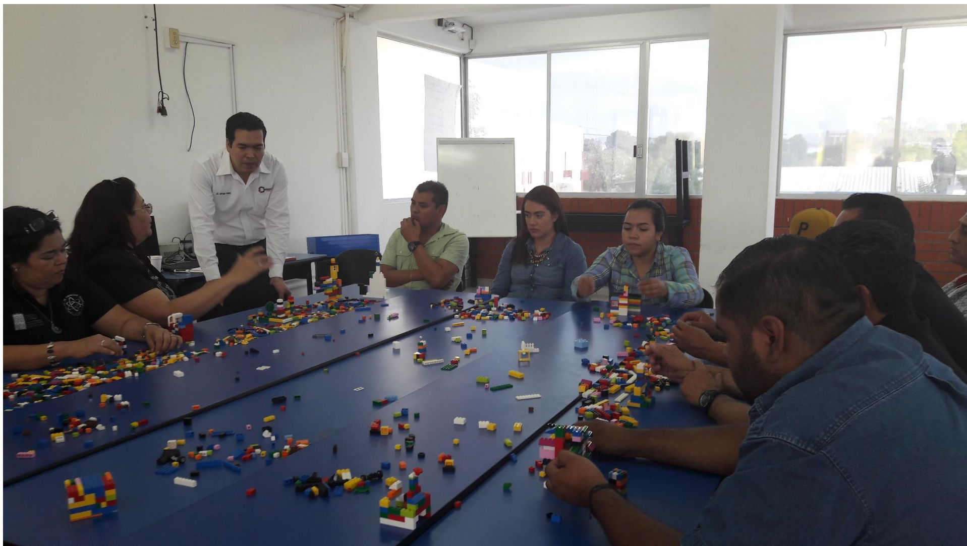
Figura 3. Curso taller con trabajadores administrativos. Integración y mejora de comunicación “Lego Serious Talento y Personas”