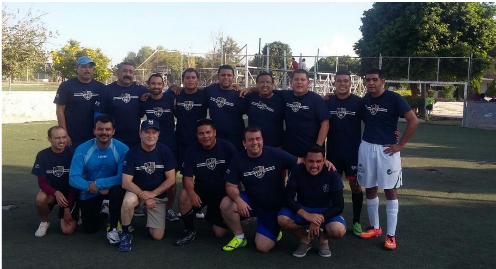
Figura 10. Equipo de maestros “Campeones del Torneo de Fútbol Uruguayo” de los eventos deportivos del 10° Simposium Internacional de Ciencias Químicas.