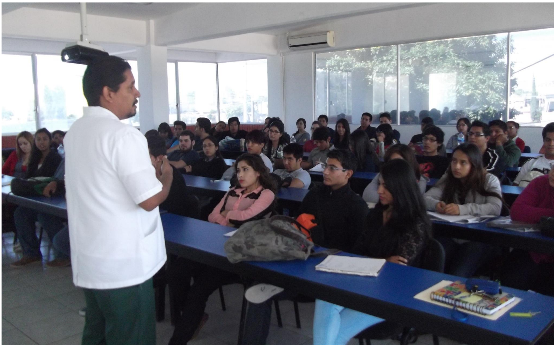
Figura 4. Pláticas para alumnos sobre prevención de enfermedades cardiovasculares y crónico degenerativas.