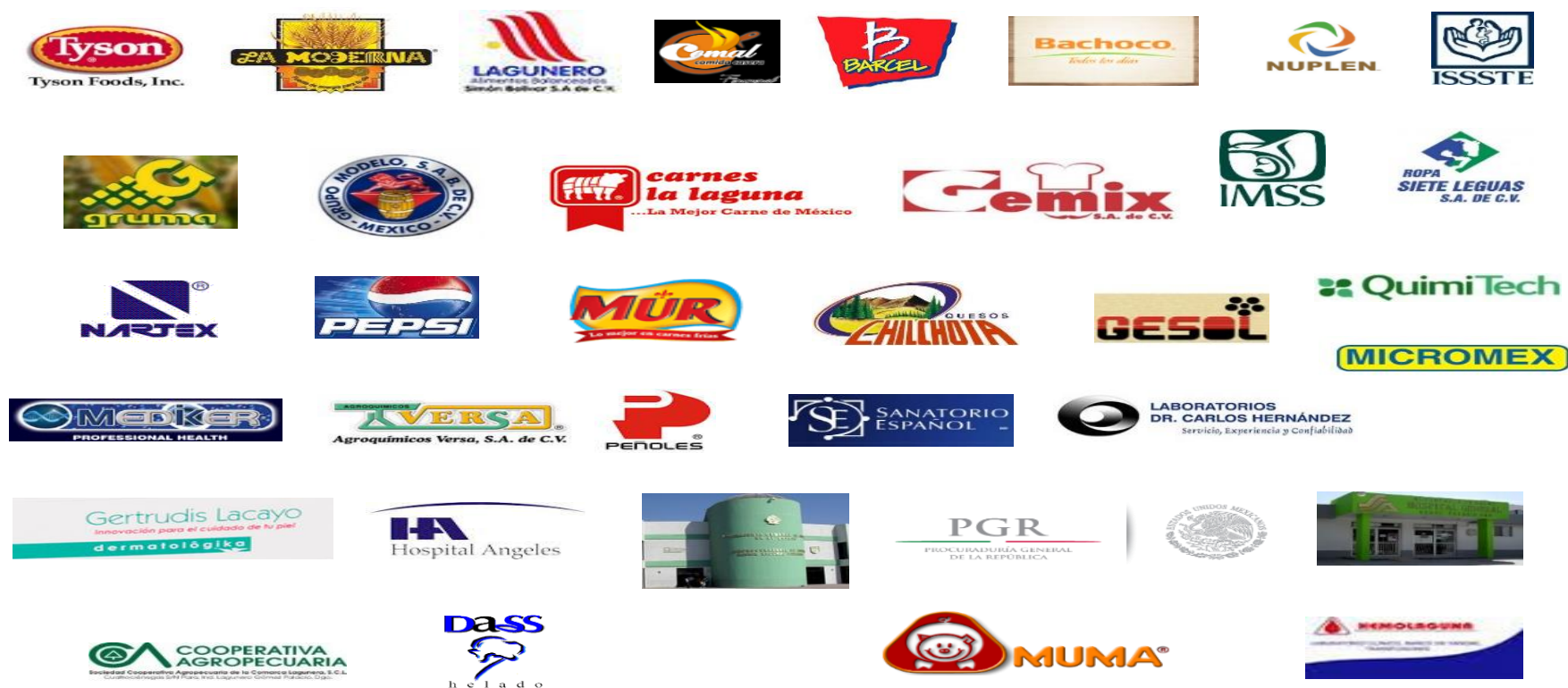
Figura 9. Empresas e instituciones facilitadoras de prácticas profesionales.

En este documento queremos agradecer, reconocer y felicitar por parte de todos los integrantes de la Facultad y de la administración 2012 – 2018, a todas las empresas e instituciones que han facilitado la realización de prácticas profesionales, de los alumnos egresados de carreras de Ingenieros Químicos en Alimentos y Químicos Farmacéuticos Biólogos durante un décimo semestre con una duración de 600 horas en un período de seis meses, por lo hoy en día todos los egresados de esta Facultad cuentan con experiencia laboral en el área de su disciplina profesional. Por Ustedes es posible tener más profesionistas mejor preparados.