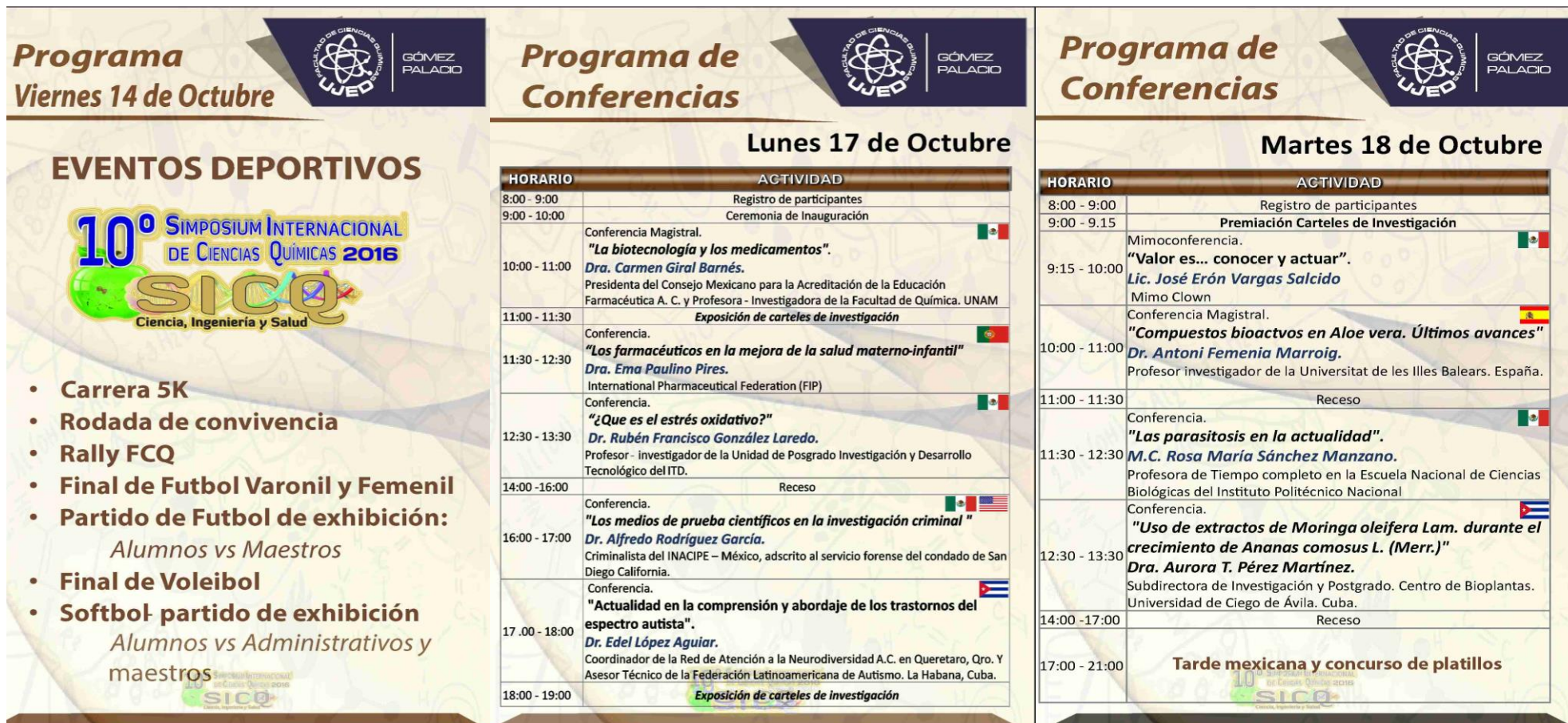
Figura 4. Logo, cartel y programa del 10° Simposium Internacional de Ciencias Químicas 2016