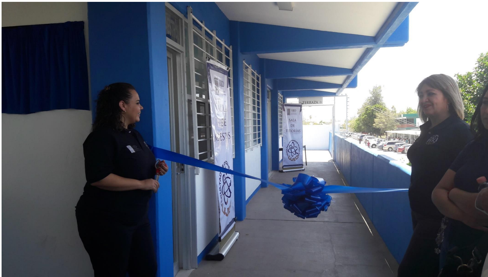
Figura 11. Inauguración de las áreas de aula de maestros, sala de tutorías y terraza de estudios.