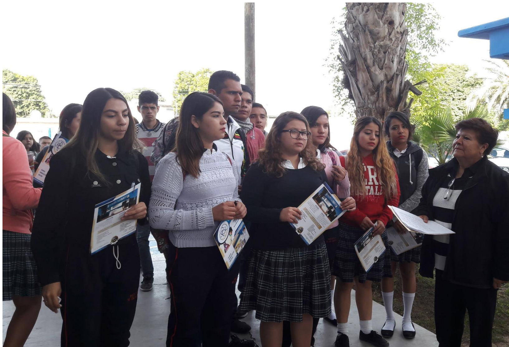
Figura 6. Casa Abierta Facultad de Ciencias Químicas Gómez Palacio - UJED.